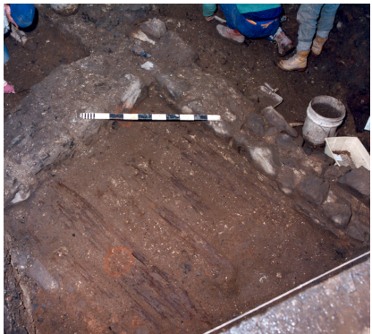
Vestiges de la maison Couillard.

Des recherches archéologiques menées en 1991 et en 2002 ont permis de mettre à jour les vestiges de la maison des Couillard dont on peut voir le périmètre dans la cour des Petits du Séminaire. Cette maison était constituée de deux carrés d'époques différentes, l'un, plus rudimentaire, construit à colombages, l'autre, plus récent, mieux adapté au climat, construit en pièce contre pièce. Parmi les artefacts récupérés par les archéologues, un poids d'apothicaire qui les amène à penser que la partie ancienne était la première maison de Louis Hébert.