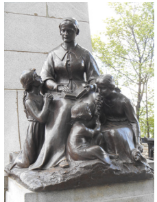
Statue de Marie Rollet.

Marie Rollet épouse Guillaume Hubou le 16 mai 1629, quelques semaines avant la prise de Québec par les frères Kirke. À la suggestion de Champlain, Marie et sa famille (qui comprend son fils Guillaume, sa fille et son gendre) décident de rester dans la colonie. À cette famille élargie s'ajoutent les deux jeunes Amérindiennes qui étaient les protégées de Champlain et le jeune esclave noir Olivier Lejeune. Au retour de Champlain en 1632, un jésuite dira que « c'est l'unique famille française habituée en Canada ».