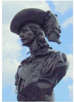
Buste de Pierre Dugua de Mons.

Pendant ses séjours en Acadie, Hébert soigne ses compagnons et les Amérindiens, dont le chef Membertou. Lescarbott rapporte « qu'il prend grand plaisir au labourage de la terre » et qu'il essaie de cultiver de la vigne. Hébert participe à la création de l'Ordre de Bon Temps qui organise des soirées gastronomiques et procure des distractions à la petite colonie.