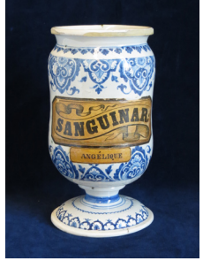
Pot de pharmacie Sanguinar / Angélique, XVII e siècle. COLLECTIONS DU MONASTÈRE DES AUGUSTINES, HÔPITAL GÉNÉRAL DE QUÉBEC

Premier hôpital au Canada (le plus ancien au nord du Mexique), l'Hôtel-Dieu de Québec fut administré pendant plus de trois siècles par les Augustines. Cédé à une fiducie en 2013, leur monastère ouvre maintenant ses portes au public. Les anciennes chambres des religieuses ont été transformées en hôtel de ressourcement. Le musée comprend notamment une salle dédiée à la médecine et rappelle que la sœur apothicairresse préparait médicaments, sirops, tisanes, pommades et onguents à partir de plantes et d'herbes, indigènes ou importées d'Europe, cueillies dans le jardin du monastère. Ce dernier comprend maintenant un « carré de l'apothicairresse ».