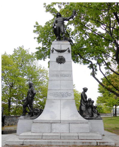
Le monument Louis-Hébert.

Champlain a dit de Hébert qu'il a été « le premier chef de famille résidant au pays qui vivait de ce qu'il cultivait ». L'artiste l'a justement représenté au sommet du monument, faucille à la main, élevant une poignée d'épis de blé vers le ciel.