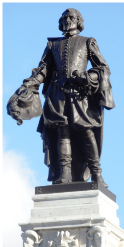
Statue de Samuel de Champlain.

Sur les terrains qui seront connus plus tard sous le nom de « Sault-au-Matelot », on trouvera bientôt des champs de céréales, des potagers et un verger de pommiers importés de Normandie.